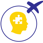
Psixi və davranış pozuntularının müalicəsi