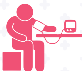
Arterial təzyiğin nəzərəçarpan dəyişikliyi